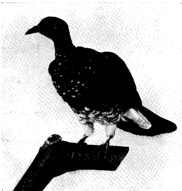
FIG. 1 — Columba speciosa (Gmelin). - Reducida a casi \frac{1}{3} del tamaño natural.