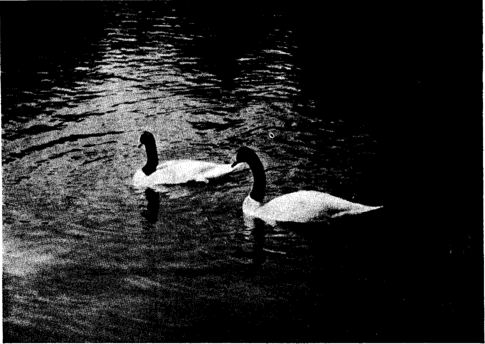
Pareja de Cisnes de Cuello Negro