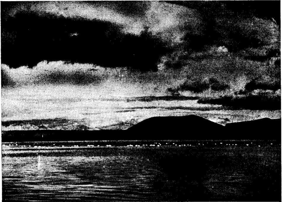
Aspecto general de la Laguna Blanca; pueden observarse en el centro los Cisnes de Cuello Negro.