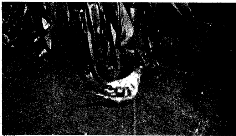
Fig. 1.—Palomita, Zenaida auriculata . Hembra adulta