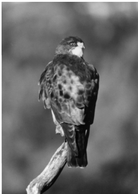
Figura 1. Individuo adulto de Buteo albigula presente en el Valle del Challhuaco, San Carlos de Bariloche, Río Negro, en enero de 2001.

Tomando en cuenta los datos del presente trabajo (Tabla 1) y los aportados por Casas y Gelain (1995), la distribución conocida de Buteo albigula hasta la fecha en la Patagonia argentina estaría comprendida entre las siguientes localidades: Lago Lolog, Neuquén (40°02'S, 71°22'O) al norte, Lago Krügger, Chubut (42°51'S, 71°48'O) al sur, y Paso Córdoba, Neuquén (40°35'S, 71°08'O) al este. El lago Krügger es también el punto extremo oeste. Todas las coordenadas fueron obtenidas con un geoposicionador satelital (Garmin 12 XL). Los ambientes donde se ha registrado esta especie son, en general, bosques dominados por Nothofagus spp. o sus periferias. Los avistajes presentados en este trabajo fueron efectuados en localidades situadas entre 330 y 1600 msnm, desde septiembre hasta abril en diferentes años. Estas fechas coinciden con las observaciones previas de Casas y Gelain (1995), y de Pavez (2000), quien observó migraciones de gran número de individuos en Chile central hacia el norte en los meses de marzo–abril y hacia el sur en octubre. Esto confirma el carácter migratorio de Buteo albigula .