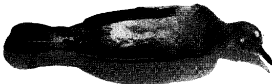
FIG. 5. — Tortolita, Eupelia cruziana Kn. et Prev. ♂ ad. (n° 0405. Col. R. A. Philippi).

Mat. colecc. 2 ♂ ad. 1 ♀ ad. Azapa, 4 Julio. (N° 0405, 0406, col. R. A. Philippi) (fig. 5).