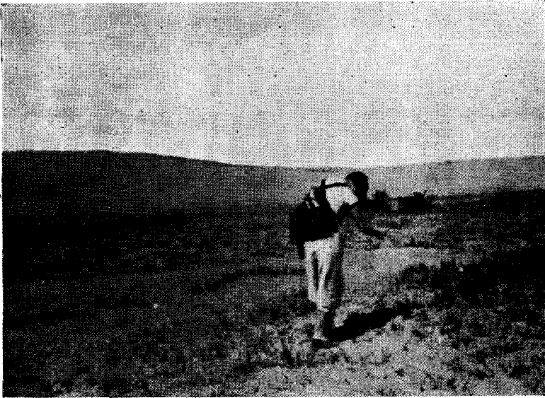
FIG. 1. — Pampas situadas al N. de Arica. Chacalluta. Habitat de Anthus lutescens peruvianus .

Material colecc. 2 ♀ ad. Chacalluta, 29 Junio.