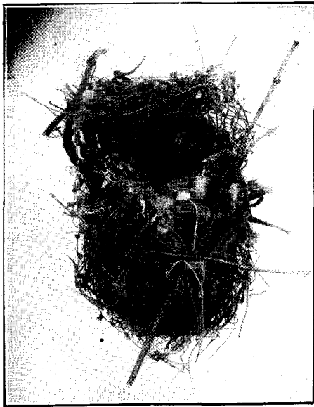
FIG. 1. — Nido del tiránido. «Pampita» o «Viudita» ( Fluvicola albiventer ).

Fluvicola albiventer (Spix). «Viudita». — Este bonito tiránido, propio del norte, fué observado por primera vez en la región en Enero último habiendo nidificado cerca de un tanque australiano rodeado de cañas, lo que es más raro aún. El nido, construido en la forma habitual, análoga