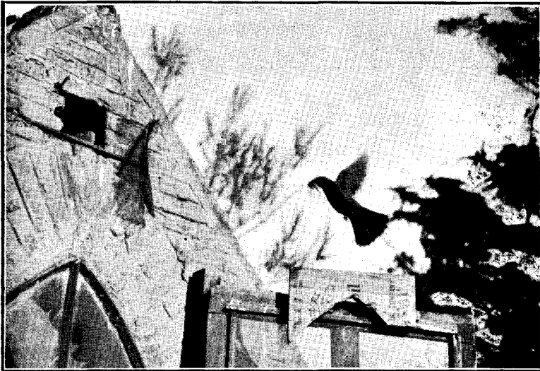
FIG. 4. — Zorzal negro de las sierras, Planesticus f. fuscater , en nidificación.

Planesticus f. fuscater (Orb. et Lafr.). «Zorzal negro». — Esta especie es, como se sabe, propia de las Sierras de Córdoba y solo por excepción