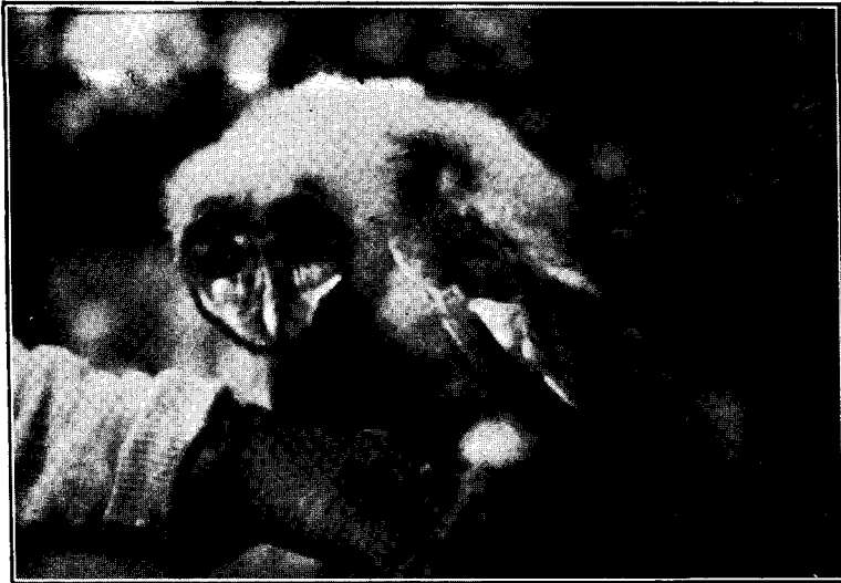
FIG. 2. — Pichón de huho o lechuzón de campanario, Tyto alba tuidara .

Tyto alba tuidara (Gray) . «Lechuzón de campanario joven». — Especie no muy común en el lugar, talvez por falta de sitios adecuados para nidificar, pues se ha observado que buscan de preferencia las paredes de los pozos, y en cuanto se hace algún boquete en un jagüel no tarda en ser ocupado por una pareja de este lechuzón. Durante el invierno he observado un ejemplar sobre una planta de ligustro, el que desapareció en la primavera. El pichón de la foto fué sacado de un pozo de molino, despojado de la madre por unos obreros. Criado guacho en cautividad se mantuvo agresivo y no llegó a amansarse del todo. Sus armas temibles eran las uñas y no era