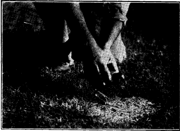
FIG. 5. — Gallineta azul, Ionornis martinica , capturada accidentalmente en Pradere (F. C. O.).

Captura de la gallineta azul, Ionornis martinica . — En el mes de Febrero último fué encontrado un ejemplar herido de la vistosa gallareta o gallineta azul, Ionornis martinica (L.), a la que le faltaba un ala. El